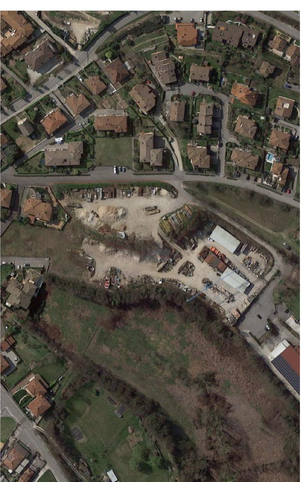
VISTA AEREA DELL'AREA DI INTERVENTO, SI RILEVANO ALCUNE GIOVANI ROBINIE IL LATO SUD, UNA SIEPE CAMPESTRE IN LATO OVEST LUNGO VIA OLIVI ED ALCUNE ROBINIE IN LATO EST A SEPARAZIONE DAI TERRENI CONFINANTI. TUTTA LA PARTE CENTRALE DEL LOTTO RISULTA PRIVA DI ALBERATURE E VEGETAZIONE