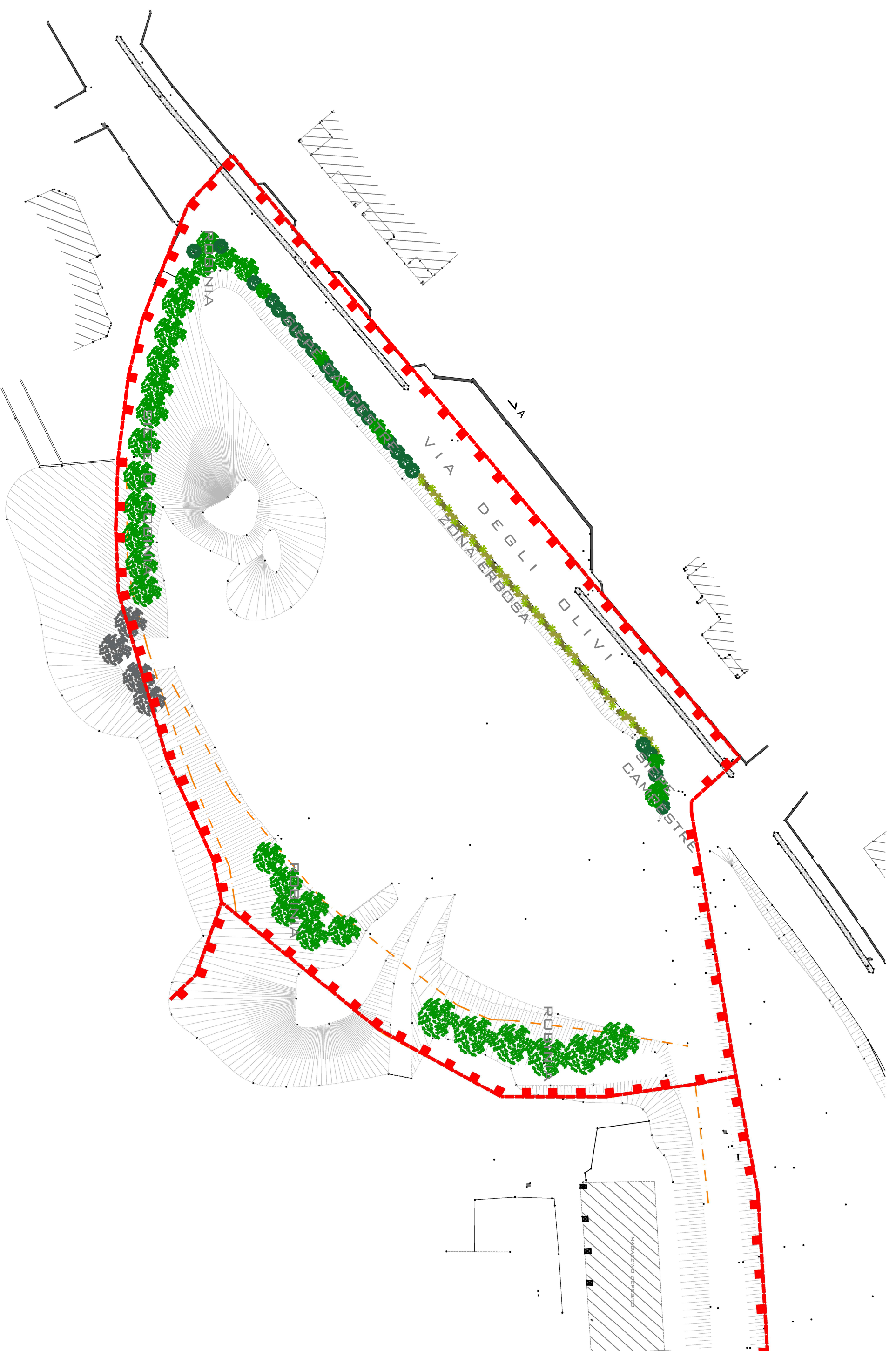
PLANIMETRIA RILIEVO ALBERATURE SCALA 1:500