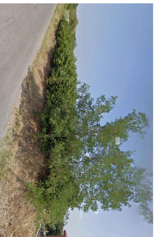
ALBERATURE LUNGO VIA OLIVI: SI RILEVANO ALCUNE GIOVANI ROBINIE E SIEPE CAMPESTRE, OLTRE AD UN TRATTO PRIVO DI ARBUSTI O PIANTE.