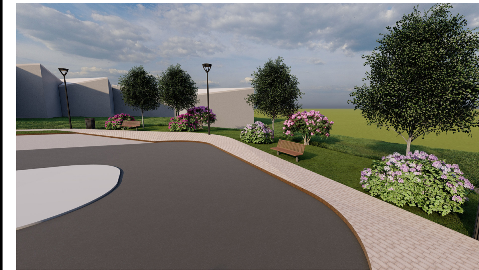
4 3D_GIARDINO COMUNALE